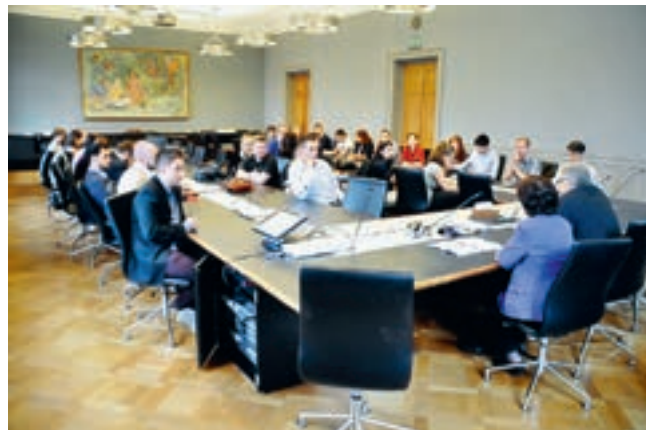
Seminar „Die Jugend baut mit an einem friedlichen Europa“ 2015 in Hölstein in der Schweiz

Solidarity Platform (CSP) eine neue Dachorganisation für Menschenrechtsgruppen entstanden. Ihr sind seither, neben vielen neueren NGOs, die meisten noch bestehenden Helsinki-Komitees beigetreten, so auch die SHV. Die OSZE bzw. der jeweilige Vorsitz organisiert immer mehr Workshops für NGOs zu ausgewählten Themen.