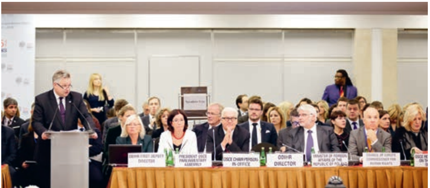
Human Dimension Implementation Meeting Warschau 2016

Wenn die frühere Präsidentin und der neue Präsident wieder öfter im Herbst zum ODIHR nach Warschau reisen, um dort am jährlichen Überprüfungstreffen der Menschlichen Dimension (HDIM) teilzunehmen und aufzutreten (vgl. Rundbrief Nov. 2016), so illustriert diese Veranstaltung eine klassische Konstellation im Gefüge der OSZE: das Neben- und Miteinander der Delegationen von Teilnehmerstaaten und von nationalen wie internationalen Nichtregierungs Organisationen (NGOs). Das Jubiläumsjahr unserer Helsinki-Vereinigung bietet eine Gelegenheit, sich über die Schweizer Erfahrungen seit 1977 hinaus ein paar allgemeine Gedanken zu machen über Rolle, Möglichkeiten und Verdienste von NGOs im Kontext des Helsinki-Prozesses.