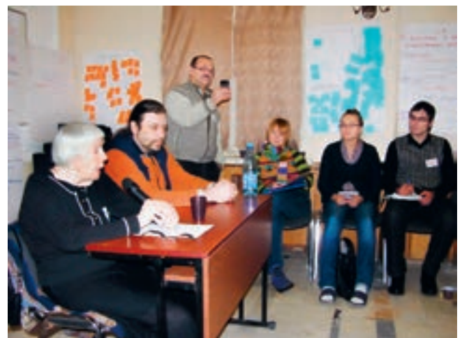
Ludmila Alexejewa, Vorsitzende der Moskauer Helsinki Gruppe, während einer Lektion der Menschenrechtsschule

Als sich die „Wende“ abzeichnen begann, nahm die MGH auf Initiative der Bürgerrechtler Larissa Bogoras, Sergej Kovalev und anderen ihre Arbeit am 28. Juli 1989 wieder auf. Frühere Mitglieder kehrten zurück. Seit 1996 amtet als Vorsitzende Ludmila Alexejewa.